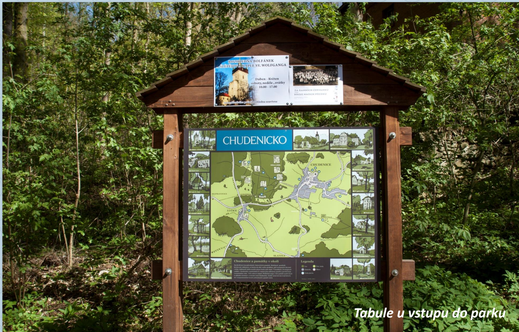
Tabule u vstupu do parku