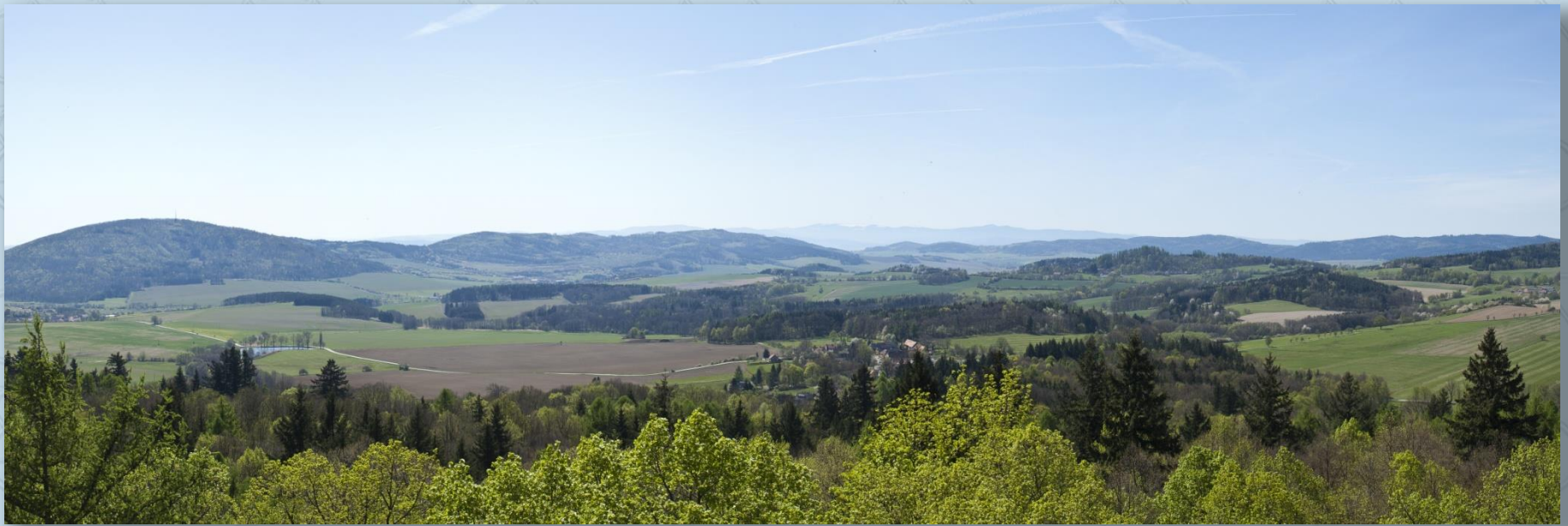
Výhled z rozhledny Bolfánek

Dostaneme se na polní cestu která nás dovede až do Poleňky. Za Poleňkou pokračujeme stále po polní cestě a to tak, že nejdříve objedeme kravín, a za ním v zatáčce pokračujeme doprava podél zdi chalupy. Tudy dojedeme do Poleně. (Do Poleně se dostaneme samozřejmě i po asfaltce, pokud by pěšina byla nesjízdná). Sjedeme dolů na návěs, dáme se vlevo ke kostelu, abychom si prohlédli památnou „Poleňskou (Dobrovského) lípu“. Vrátime se na návěs a jedeme vlevo, dolů, a na „stopce“ opět vlevo. Za mostem jedeme vlevo a napojíme se na cyklotrasu č. 305. Ta nás přivede až do Tupadel. Za obcí odbočíme doprava na zelenou turistickou značku, a pokračujeme kolem Tupadelských skal. Dojedeme ke skalám a po jejich prohlídce pokračujeme po lesní cestě vedoucí kolem skal doprava. Za chvíli jsme na asfaltce a dáme se vlevo. Nahoře na horizontu je v lese křižovatka, kterou projedeme rovně. Záhy se ocitneme na louce, po které dojedeme do Koryt a odtud pokračujeme do Bezděkova. A po cyklotrase č. 2052 dojedeme až do Nýrska.